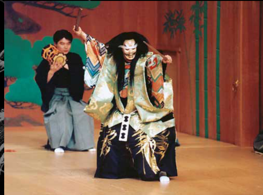
Gorin No Sho