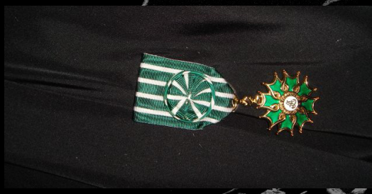
Officier de l'Ordre des Arts et des Lettres