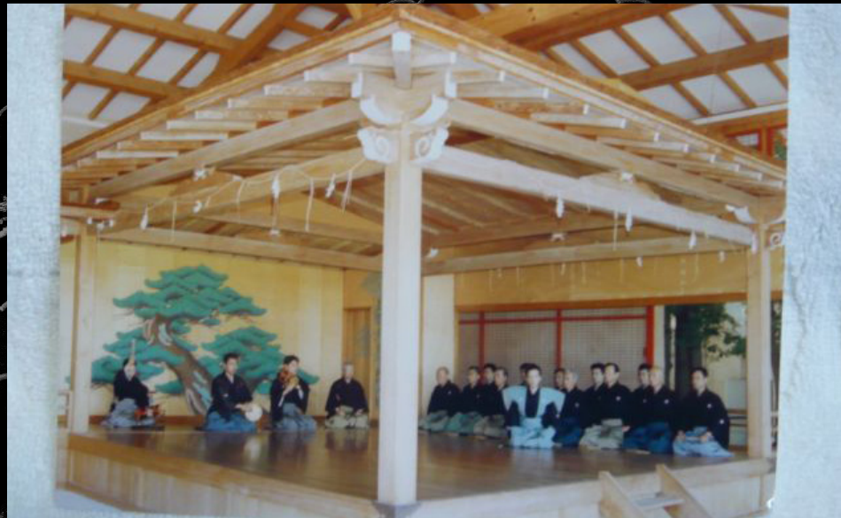
Les acteurs sont à la fois danseurs et chanteurs ( en chœur, à droite)